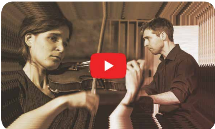
Luciano BERIO (1925-2003) - Due pezzi per violino e pianoforte II. Quasi allegretto, alla marcia