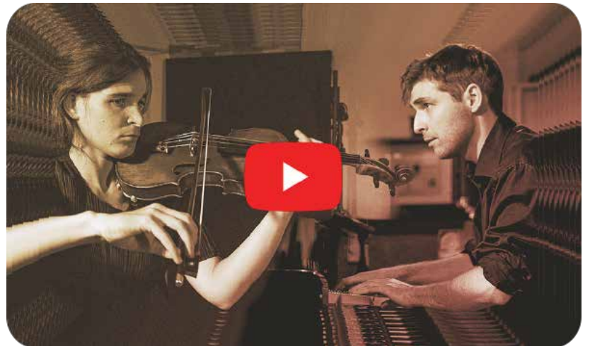
Luciano BERIO (1925-2003) - Due pezzi per violino e pianoforte I. Calmo